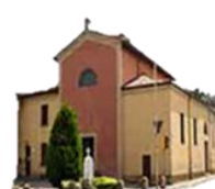
S. Giacomo della Croce del Biacco