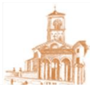
S. Antonio di Savena