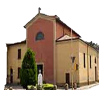
S. Giacomo della Croce del Biacco