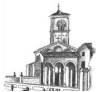
S. Antonio di Savena