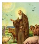
S. Antonio di Savena