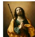
S. Giacomo della Croce del Bianco

Quale presenza sacramentale del Buon Pastore Gesù, il Vescovo di una Diocesi, almeno una volta (o più), ha da andare a visitare le parrocchie della sua Diocesi con l'intento di ricevere un resoconto completo della vita della Comunità Parrocchiale iniziando da com'è la vita sociale del territorio, alla vita di Catechesi per Fanciulli, Ragazzi, Giovani, adulti, anziani e famiglie, con l'intento di poterli incontrare in momenti strutturati in un certo modo, che dia la possibilità di poter conoscere il volto completo della Parrocchia per dare consigli, sollecitazioni e traiettorie di cammino, anche sotto l'aspetto immobiliare ed economico: infatti la Visita Pastorale va da giovedì sera 18 aprile a domenica 21 aprile.