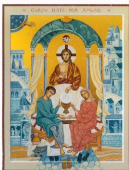
"Eucaristia e Matrimonio"

Conclusioni il 2 giugno nella solennità del Corpus Domini