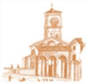
S. Antonio di Savena