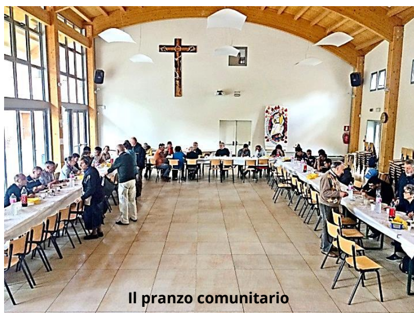
Il pranzo comunitario

Il 14 aprile 2018, a conclusione della stagione, si è svolto il pranzo comunitario al quale hanno partecipato gli ospiti della Tavola della Fraternità, i volontari e alcuni loro familiari. Il pranzo, preparato dalle attivissime e bravissime volontarie, si è tenuto in sala "Tre Tende" e ha visto la partecipazione di una cinquantina di persone.